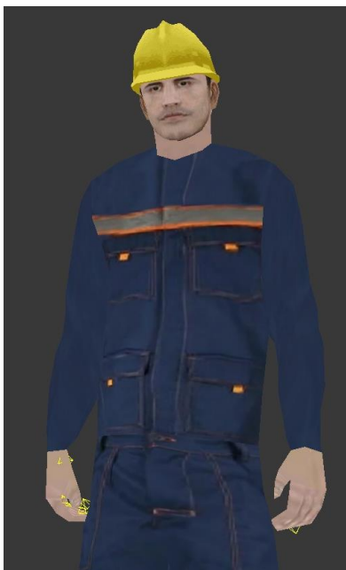
Рис. 2. Модель очков и инструментов

Текстуры для одежды, головы, аксессуаров и других элементов были взяты из открытых источников. Изменив подобранные текстуры в программе «Adobe Photoshop» была сформирована модель человека. Разработанная модель представлена на рисунке 2. Аналогично была разработана модель инструментов, пояса и защитных очков (рис. 3). Была выполнена анимация модели, добавление текстурной части и озвучивание видеоинструктажа.