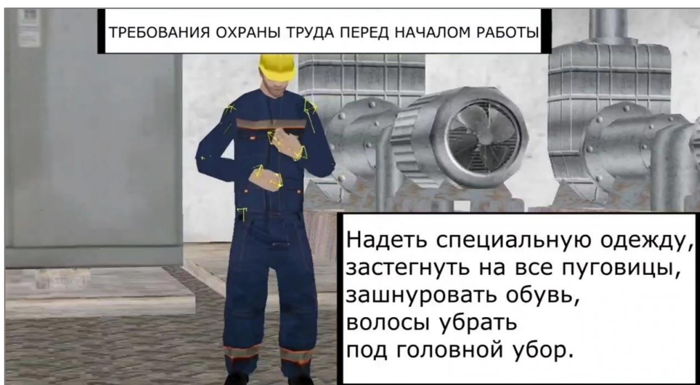
Рис. 1. Видеоинструктаж

На рисунке 1 показан пример разработанного видеоинструктажа.