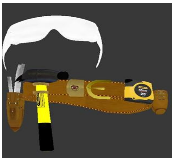
Рис. 3. Модель очков и инструментов

Разработка видеоинструктажей является сложным процессом, требующих от разработчика знаний и навыков в различных областях. В результате проделанной работы был разработан видеоинструктаж по одной из тем учебной практики. В дальнейшем планируется разработка комплекса видеоинструктажей.