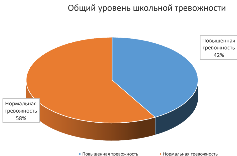
Рис. 1. Результаты общего уровня школьной тревожности по методике Филлипса

Согласно полученным результатам исследования по методике Филлипса мы выявили, что у 42% детей констатируется повышенный уровень тревожности (10 учеников). Представим результаты схематически на рис.1.