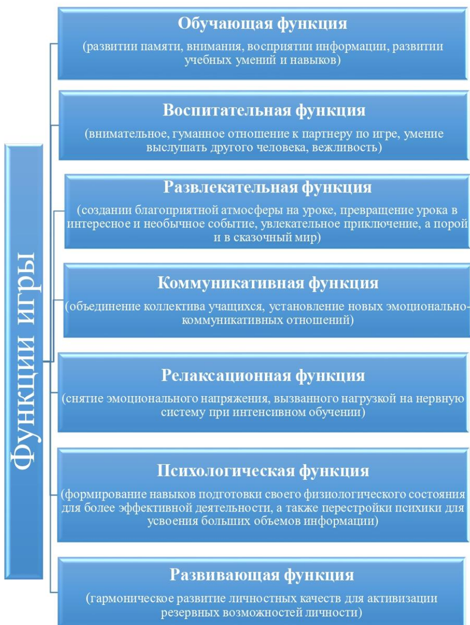
Рис. 1. Функции игры

Успешно овладеть математическими знаниями помогает планомерное формирование у школьников познавательного интереса к обучению и к изучению математики, в том числе. Познавательный интерес можно рассматривать как комплекс индивидуальных качеств ученика, черт его характера выражающихся в активности, настойчивости, изыскательности.