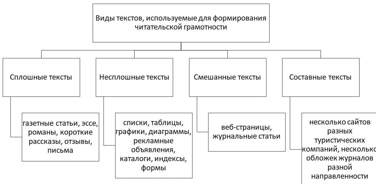
Рис. 1. Виды текстов, используемые для формирования читательской грамотности на уроках английского языка

Рассмотрим основные приемы работы с текстами на уроках английского языка с точки зрения универсальных учебных действий, формируемых в этом процессе (таблица 1).